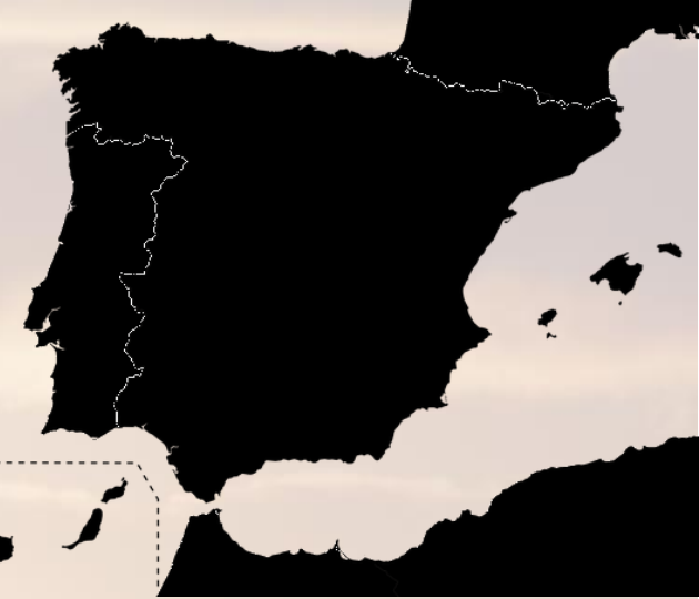
Gasto turístico por países en España. Acumulado a octubre de 2020 (millones de €)